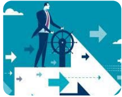
TABLEAU DE BORD RSE 2021